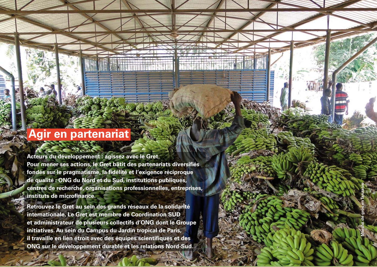
Marché de gros en Tanzanie